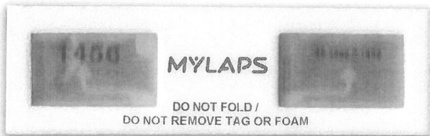
Σχέδιο chip χρονομέτρησης